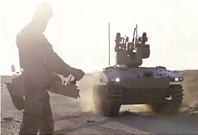
Ci-dessus : Un opérateur à côté d'un Soratnik . Celui-ci est employé en Syrie par les forces spéciales russes.