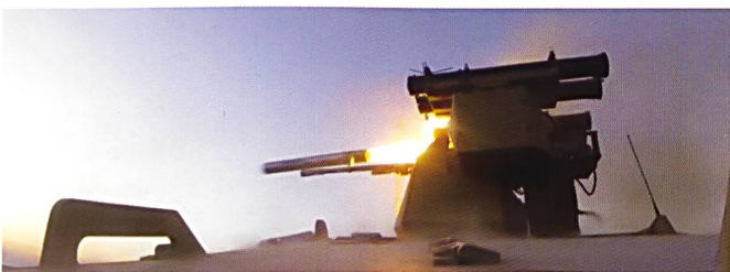
Ci-dessous : Tir d'un missile antichar guidé Kornet par un Soratnik .