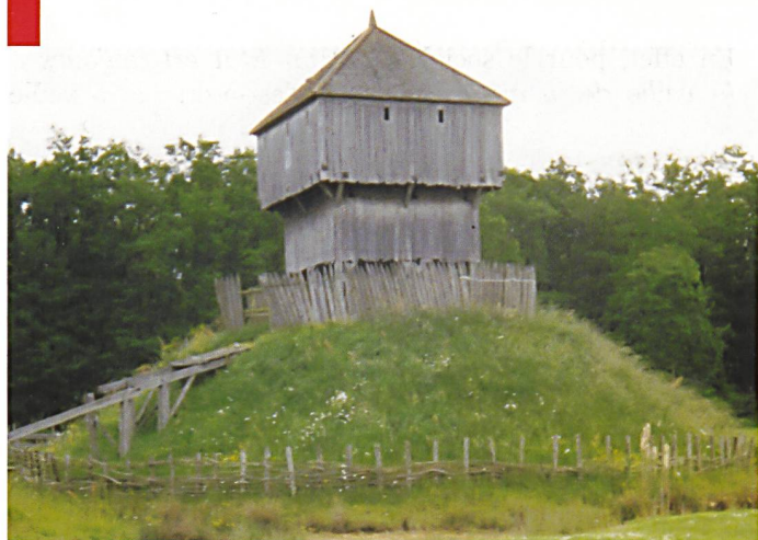
Une motte castrale. Celles-ci étaient généralement constituées d'une levée de terre de 15 m de haut, entourée de 50 m de palissade. Une partie disposait en sus d'une tour, comme sur la photographie ci-dessus.