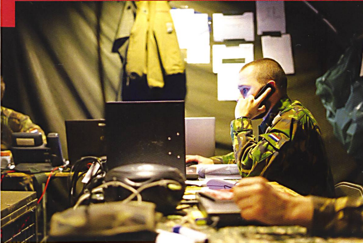
Toutes les illustrations : Le travail au sein du poste de commandement de la 43 e brigade néerlandaise. Voir article page 40.