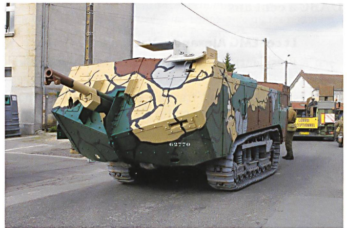
Le char Saint Chamond pèse entre 22 et 24 tonnes. Il est lourdement armé, car la Direction des services automobiles exigeait le montage d'un canon de campagne de 75 mm sur son affût depuis l'engin – ce qui ne pouvait évidemment qu'alourdir l'ensemble et le rendre impropre à la manœuvre.

Le char Renault FT17 –ici un engin « femelle » car armé d'une mitrailleuse– a été le premier char de combat pour de très nombreuses armées, y compris la suisse.