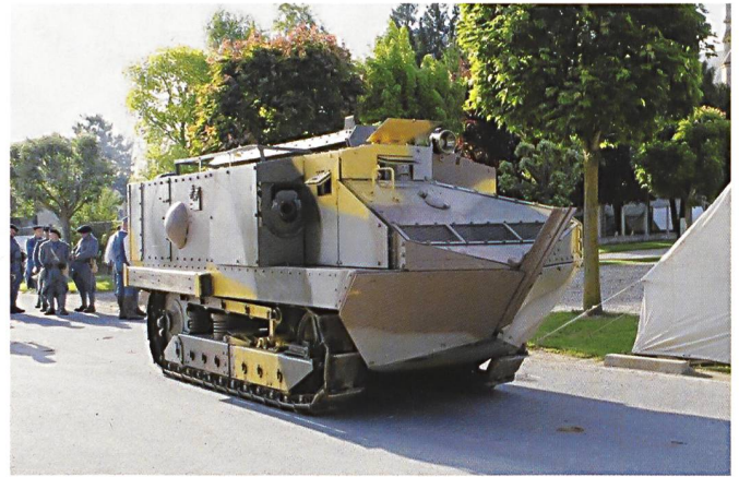
Le char Schneider CA1 pèse 13,6 tonnes et emporte une arme de 75 mm à canon court, ainsi que deux mitrailleuses