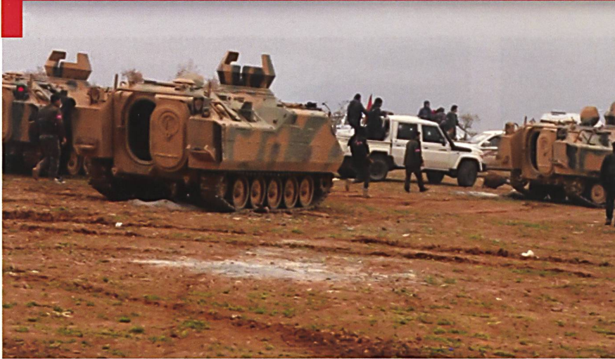
Trois transports de troupe turcs sans mitrailleuses mis à disposition des forces irrégulières (mi-février 2017).