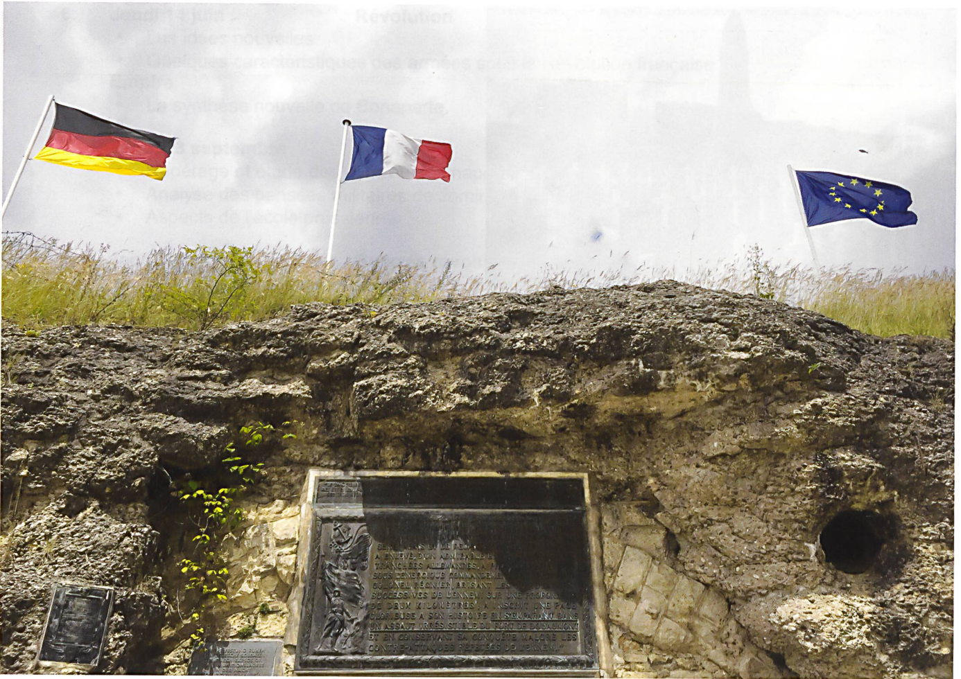
Ci-dessus : L'entrée du fort de Douaumont, qui a durant la majorité des 300 jours de la bataille de Verdun, été tenu par les soldats allemands. Ci-dessous : Une visite à la citadelle de Verdun permet de voir une exposition consacrée à la désignation du soldat inconnu.