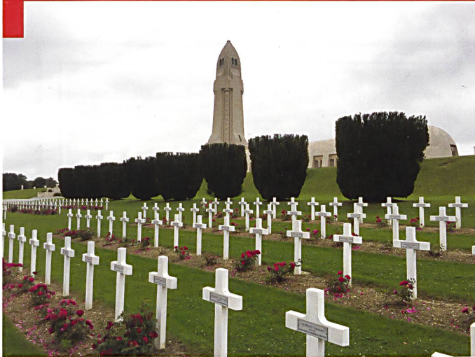
Une vue impressionnante de l'ossuaire de Douaumont, entouré de cimetières.