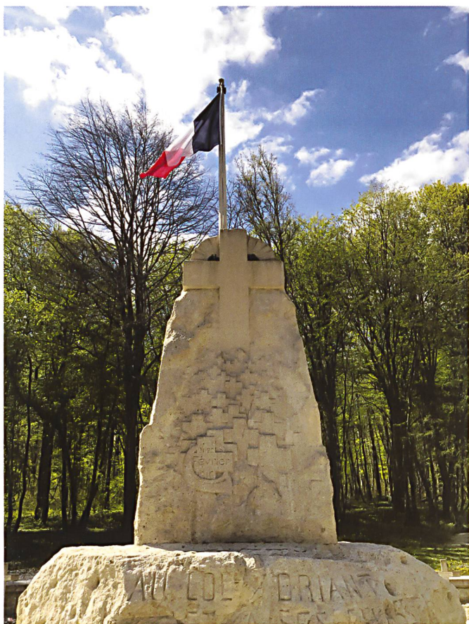
Un monument a été érigé à l'endroit où est tombé le colonel Driant.

planifiée pour le 10 février, l'opération GERIHT 19 débute le 21 février 1916 par un déluge de feu et d'acier. Entre 7h30 et 16h00, on estime que 80'000 obus sont tirés sur le secteur du Bois des Caures, rectangle d'environ 1'300 mètres de long sur 800 mètres de large. On peine à imaginer que des hommes aient pu survivre à cet enfer. Et pourtant, les chasseurs opposent une résistance qualifiée d'héroïque et, toute réserve mémorielle exprimée, que l'histoire retiendra comme déterminante pour retarder l'avancée allemande. Driant est tué d'une balle dans la tête le 22 février 1916. 20