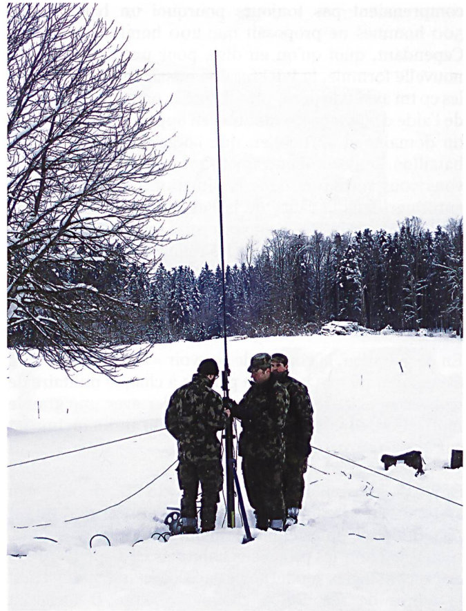
Ci-dessus : Installation d'antennes-relais VHF pour le réseau tactique SE-X35.

Ce premier cours fut donc mouvementé, ne serait-ce que parce que mes interlocuteurs et partenaires ne