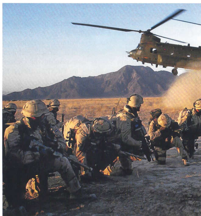
Ci-dessous : Parfois, la compagnie « Jonquille » se déplace à bord de Chinook CH-47 américains.