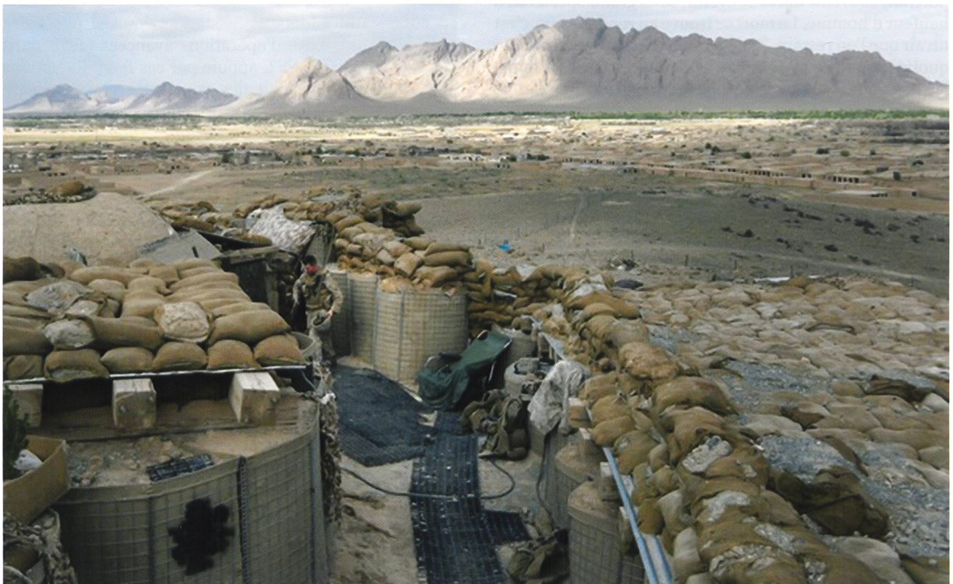
Partie d'une FOB.

Après des combats par le feu, presque tous à distance contre des talibans, le nombre de militaires du rang qu'il faut évacuer vers la France pour des raisons psychiques ou de stress post-traumatique apparaît étonnamment