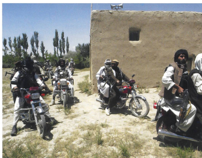
Ci-dessus : Des talibans, toujours très mobiles.