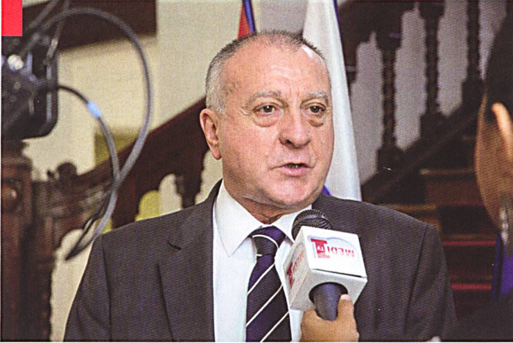
L'auteur parle de son ouvrage.