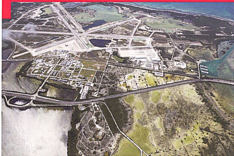
La base aérienne de Key West (Floride) en 2016. Elle fait partie des infrastructures de la défense américaine menacées de submersion partielle ou totale d'ici à 2100. 70 à 95 % de sa surface pourraient disparaître à la fin du siècle