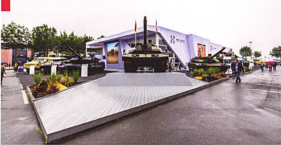
Un stand unique pour KMW et Nexter, un « char européen » entre le Leopard et le Leclerc - Tout un symbole pour l'édition 2018 du salon européen de l'armement.