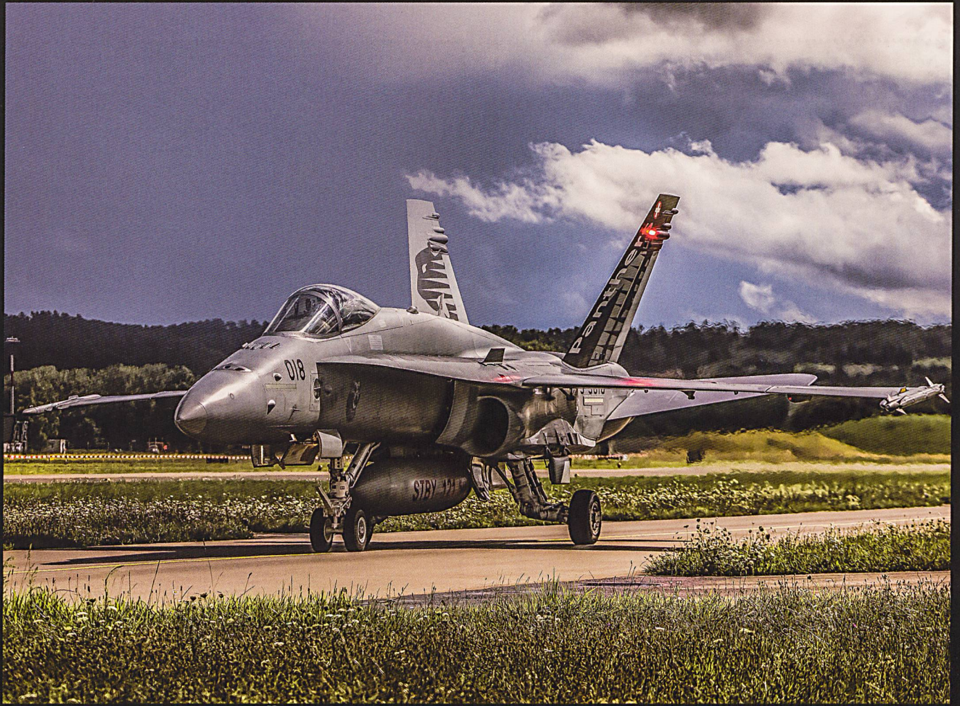
DIE NOCTUQUE - de jour comme de nuit.