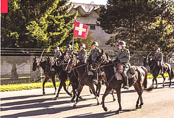
Traditions et fidélité aux valeurs : L'escadron de cavalerie, à la journée de l'armée de Thonon en 2017.