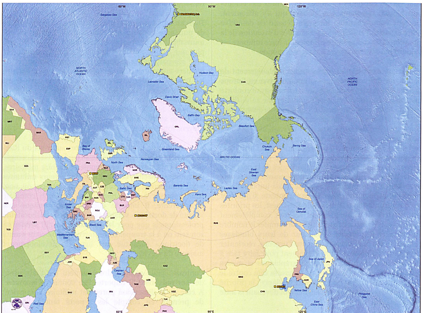
Le monde vu depuis l'Arctique (carte SRM).