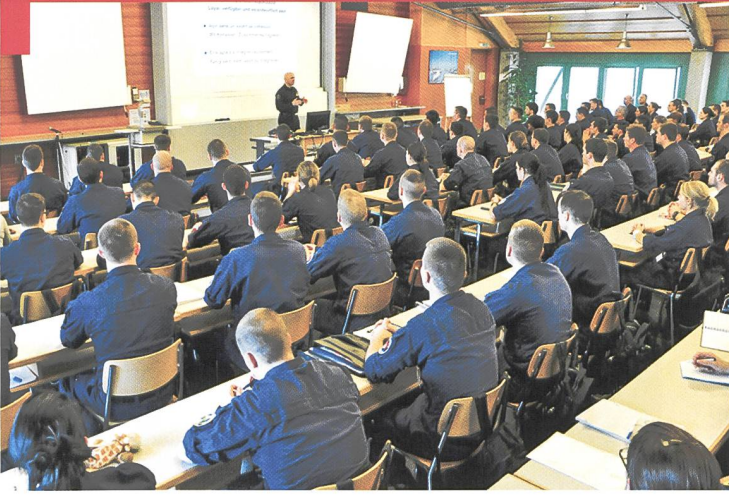
L'Académie de police de Savatan est responsable de la formation de base des policiers vaudois, valaisans et genevois.