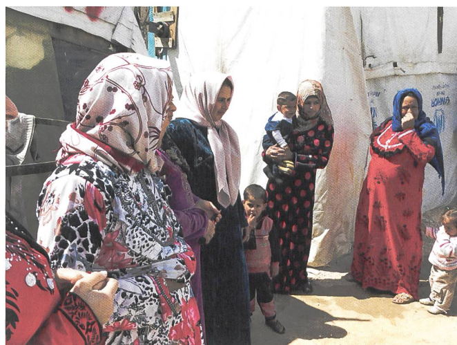
refugiées syriennes au Liban. Photo URD.JPGs.

Parmi les projets des cinq pays présentés: qu'est-ce qui les différencie et/ou les unis? M. Grünwald: « On les a choisies pour illustrer les différences. Le Mali parce que c'est une crise durable dans un contexte complexe de danger de développement. Le Yémen, c'est une guerre atroce aux impacts humanitaires majeurs avec la complicité de pas mal d'Etats dont le nôtre. Le Kenya car c'est un pays qui est en train de démontrer sa capacité de gestion des sécheresses toute a fait intéressant. Comment l'aide internationale peut arriver à soutenir et s'insérer dans des démarches nationales. Au Bangladesh, la crise des Rohingyas qui après la Syrie est le plus grand déplacement de réfugiés dans un pays touché lui-même par des changements climatiques. » Un pays pauvre en difficulté et qui reçoit un afflux considérable de population.