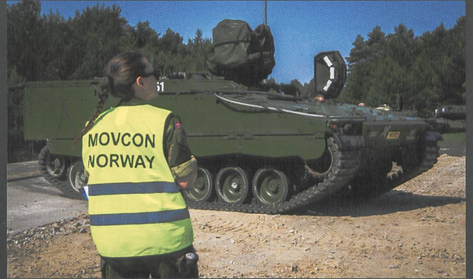
Ci-dessus : Véhicules de combat d'infanterie (VCI) Marder allemands et CV90 norvégiens.