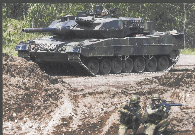
A gauche et ci-dessous : Le char de grenadiers Marder est encore bien présent dans la Bundeswehr. A droite : Léopard 2 A7 .