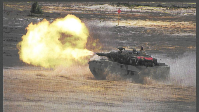
Ci-dessus : Les chars Léopard 2 A4 de la 11 e brigade blindée polonaise sont issus des surplus de la Bundeswehr.