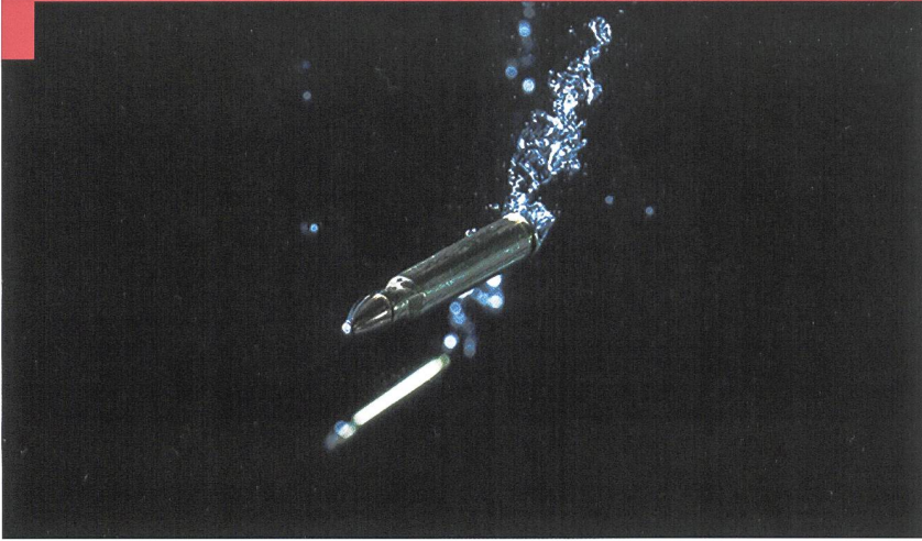
Une munition en milieu aquatique.