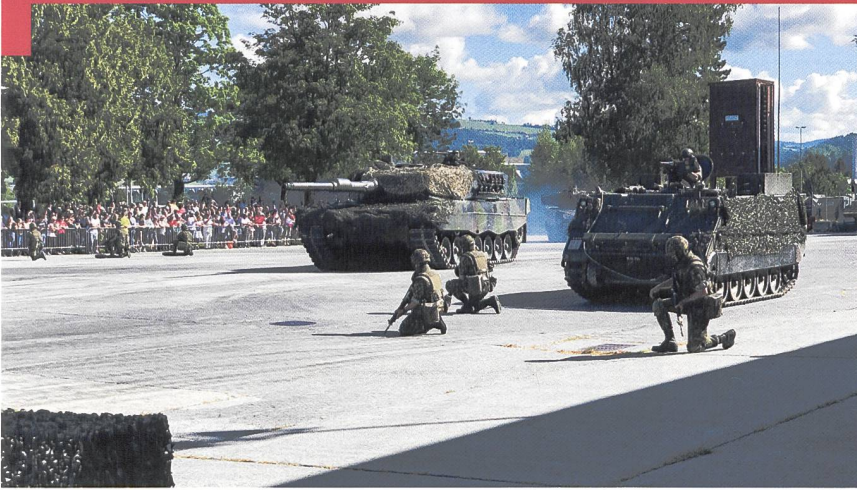
Démonstration de l'engagement d'une section de sapeurs de chars, ouvrant un passage obligé, aussitôt franchi par une section de chars 87 Léopard .