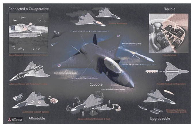
La vision britannique de la 6 e génération représentée par le Team Tempest .

La rupture de ces différents programmes se retrouvent déjà pour la plupart dans leur nom. Il s'agit essentiellement non plus de développer un avion mais un bien un système complet de guerre aérienne. Le besoin commun exprimé par les états-majors français et allemands qui est à l'aune