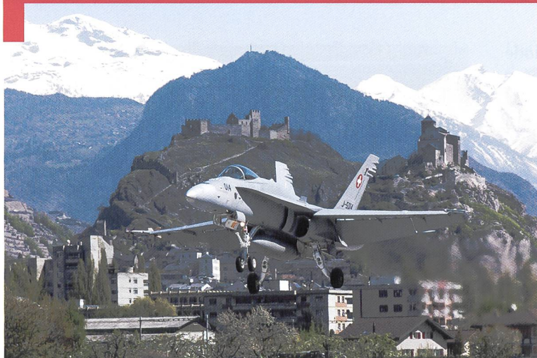
F/A-18 à l'atterrissage à Sion.