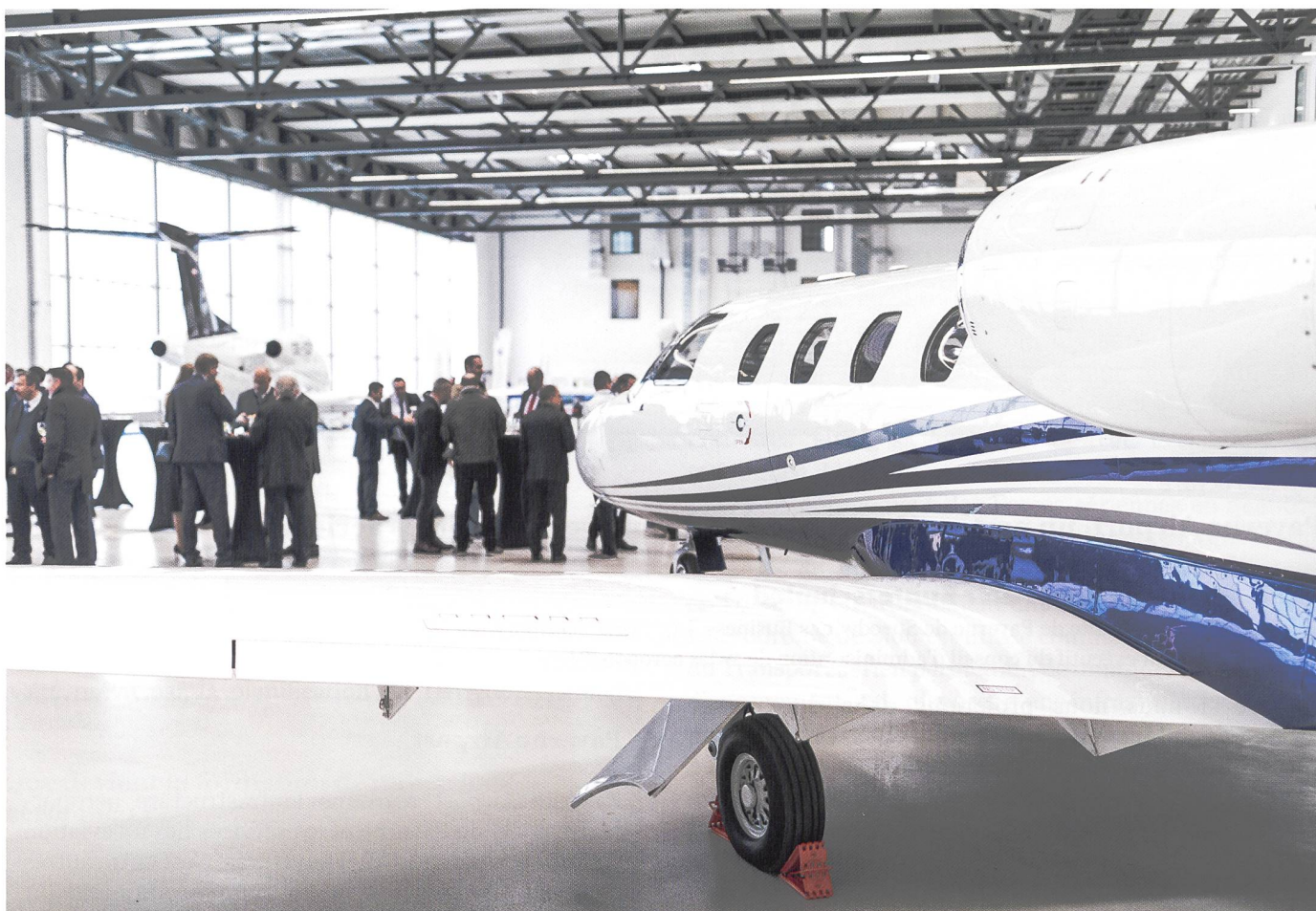
Le terminal de Payerne Airport a été inauguré au printemps 2019.

Vols directs, horaires sur-mesure sont synonymes d'efficacité et économie de temps. Des éléments déterminants pour le succès des entreprises.