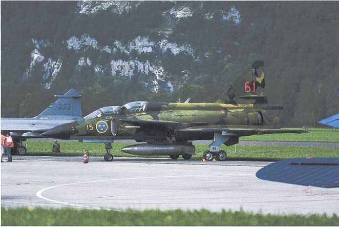
Le J37 est en bonne place sur la ligne de vol de Mollis.

et de Su-27 au-dessus de la mer Baltique. Il a ainsi acquis une solide réputation, une grande popularité en Suède, tout comme à l'étranger. Mais malheureusement, le Viggen n'a jamais pu être vendu ou exporté.