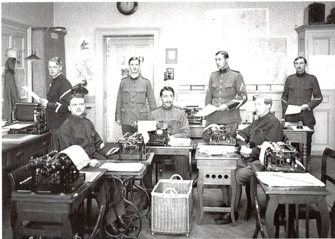
Bureau de l'office de renseignement de la Confédération, 1914-1918