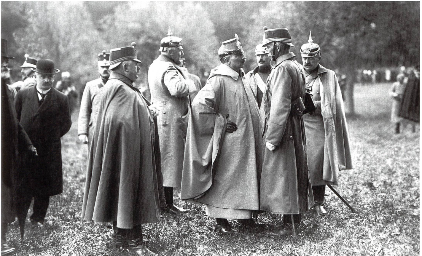
Manœuvres de l'empereur en 1912 dans les Grisons. Face à face entre l'empereur Guillaume II et Theophil Sprecher von Bernegg. Au premier plan Ulrich Wille, à gauche les Conseillers fédéraux Louis Perrier et Arthur Hoffmann