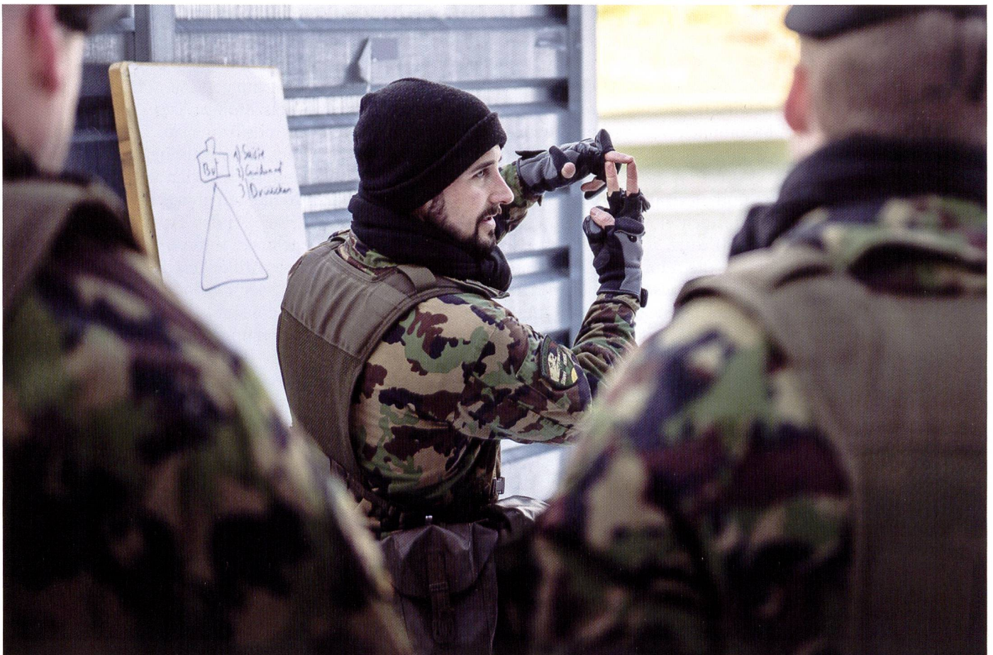
Ci-dessous : Instruction périodique à l'arme personnelle pour les cadres de l'état-major, à Thoun ou à Schwarzenburg.