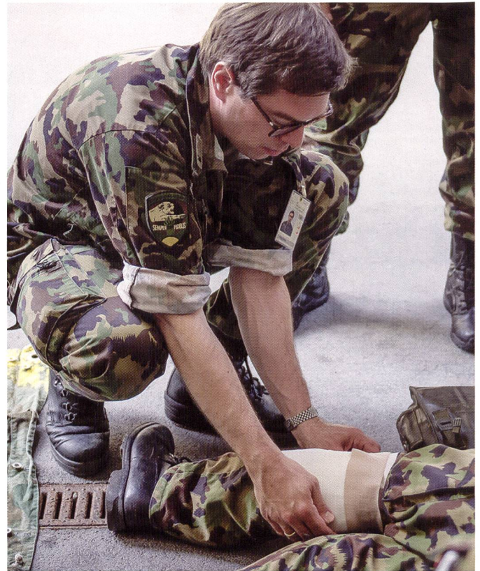
Ci-dessus : Le médecin de brigade est notamment responsable de la formation appropriée de l'état-major de brigade dans le domaine sanitaire.