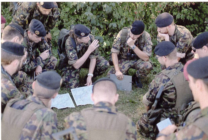
Donnée d'ordres et débriefing de l'exercice s'effectuent dans le terrain.