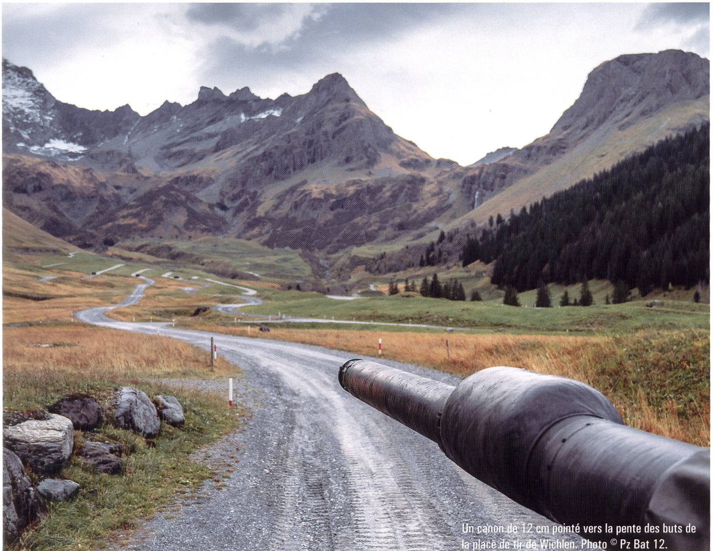
Un canon de 12 cm pointé vers la pente des butts de la place de tir de Wichlen.