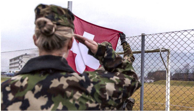
A compétences égales, chances égales.