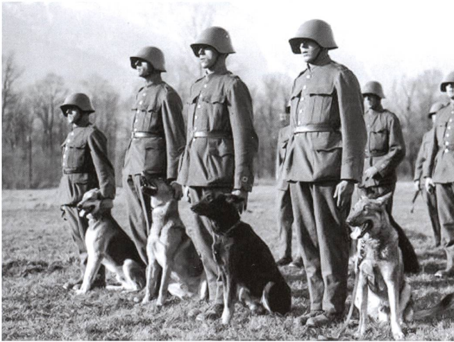
Ci-dessus: La sûreté des frontières et des infrastructures explique la création de nombreuses formations dédiées, y compris des unités de maîtres chiens.