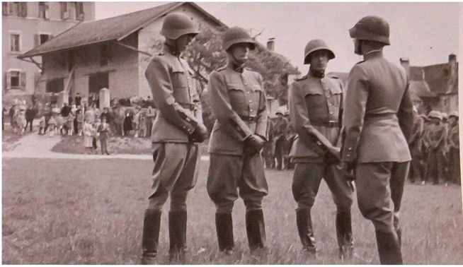
Ci-dessus, en haut : Appel principal: Les chefs de section reçoivent leurs instructions.