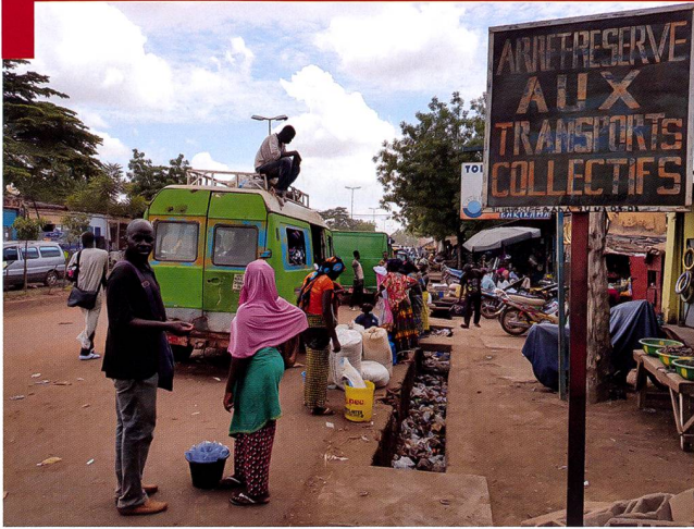
Une gare routière dans le Sahel : pour aller où ?