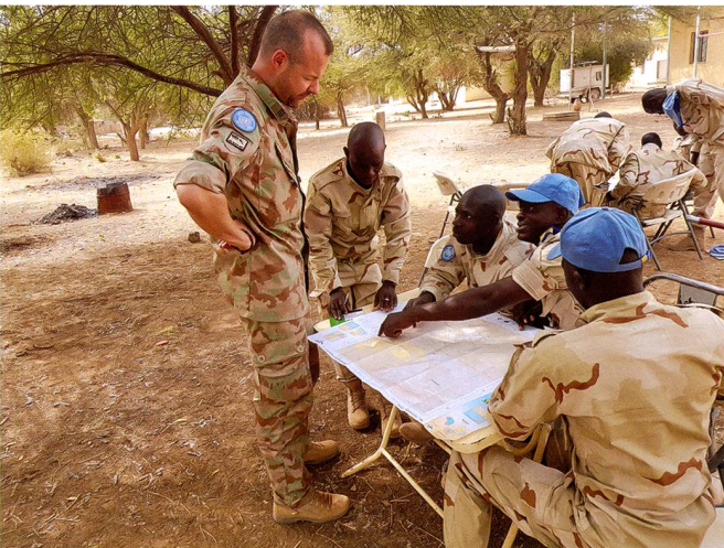
Formation de bérets bleus burkinabé en « zone compliquée ».

et d'incitations aux pèlerinages à la Mecque. L'Islam africain, après s'être développé de manière autonome, se voit recadrer par ses puissants parrains. Le djihadisme armé, lui, opère selon un mode de fonctionnement observé et vérifié : de petits groupes en motos imposent, village par village, les nouvelles règles, d'abord par la persuasion, puis par la contrainte. Il n'est d'ailleurs pas rare que les autorités traditionnelles aient auparavant été assassinées et les écoles brûlées, ceci afin de marquer l'avènement d'un « nouvel ordre », régi par de nouvelles règles. Une partie de la population est convertie afin de servir d'informateurs, de logisticiens, au mieux de combattants. La population finit par se soumettre à ces nouveaux occupants pour avoir la paix. Ce scénario se déroule quotidiennement au Mali comme au Burkina depuis 2015 et 2016, et plus récemment au nord-ouest du Niger.