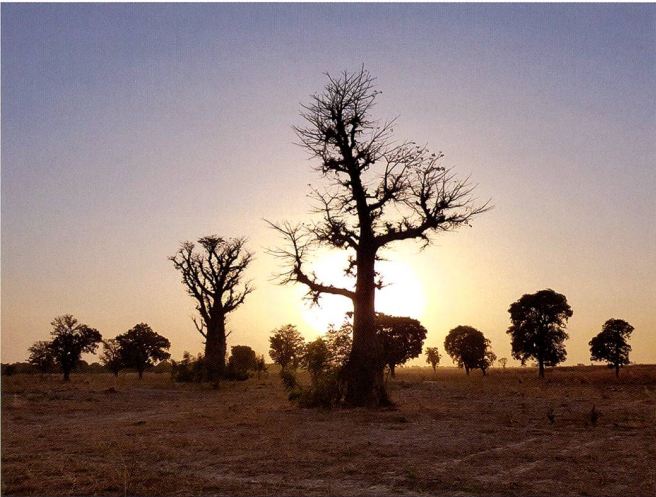
Ci-dessous : Coucher de soleil sur la campagne malienne.

religieuse prend deux formes majeures : le djihadisme armé et le prosélytisme des pays du Golfe. Tandis que le premier fait l'objet de toutes les préoccupations, le second agit discrètement en sous-main, sous couvert de financements de mosquées, de formation d'imams locaux,