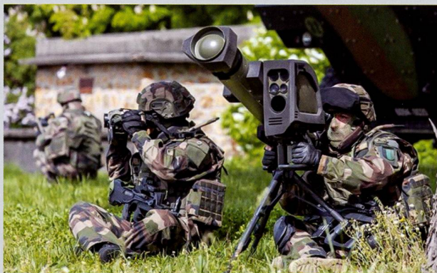
Ci-dessus : Prêt au tir, le système peut être desservi par un seul tireur, ce qui permet à l'équipe de garantir l'observation sur la durée.