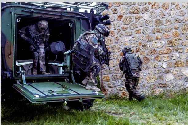
Ci-dessous : Le système embarqué dans un véhicule blindé de combat d'infanterie (VBCI) est encombrant et n'est pas voué à être transporté sur de longues distances.