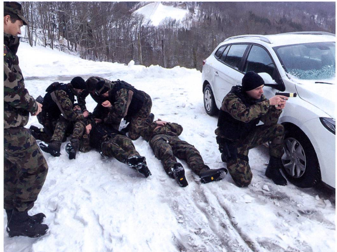
Ci-dessus : L'instruction se focalise sur les techniques et tactiques de police de sécurité.

Lundi 2 mars, secteur Wangen an der Aare. Les soldats des cp entrent en service, un peu déboussolés par les mesures décidées. Les accolades habituelles de retrouvaille font place à un certain inconfort. Tout le monde connaît la situation, tous ne l'ont pas encore pleinement appréhendé. À cette date, « seulement » onze cas sont confirmés en Suisse. Les cadres sont sur place pour garantir l'application des mesures de distanciation. Un soldat annonce avoir séjourné récemment en Lombardie. Il est immédiatement isolé ainsi que onze autres camarades avec lesquels il a eu du contact. Trois autres soldats sont envoyés au centre médical régional pour y effectuer un test de dépistage. Seul le test du soldat rentrant de Lombardie s'avéra positif.