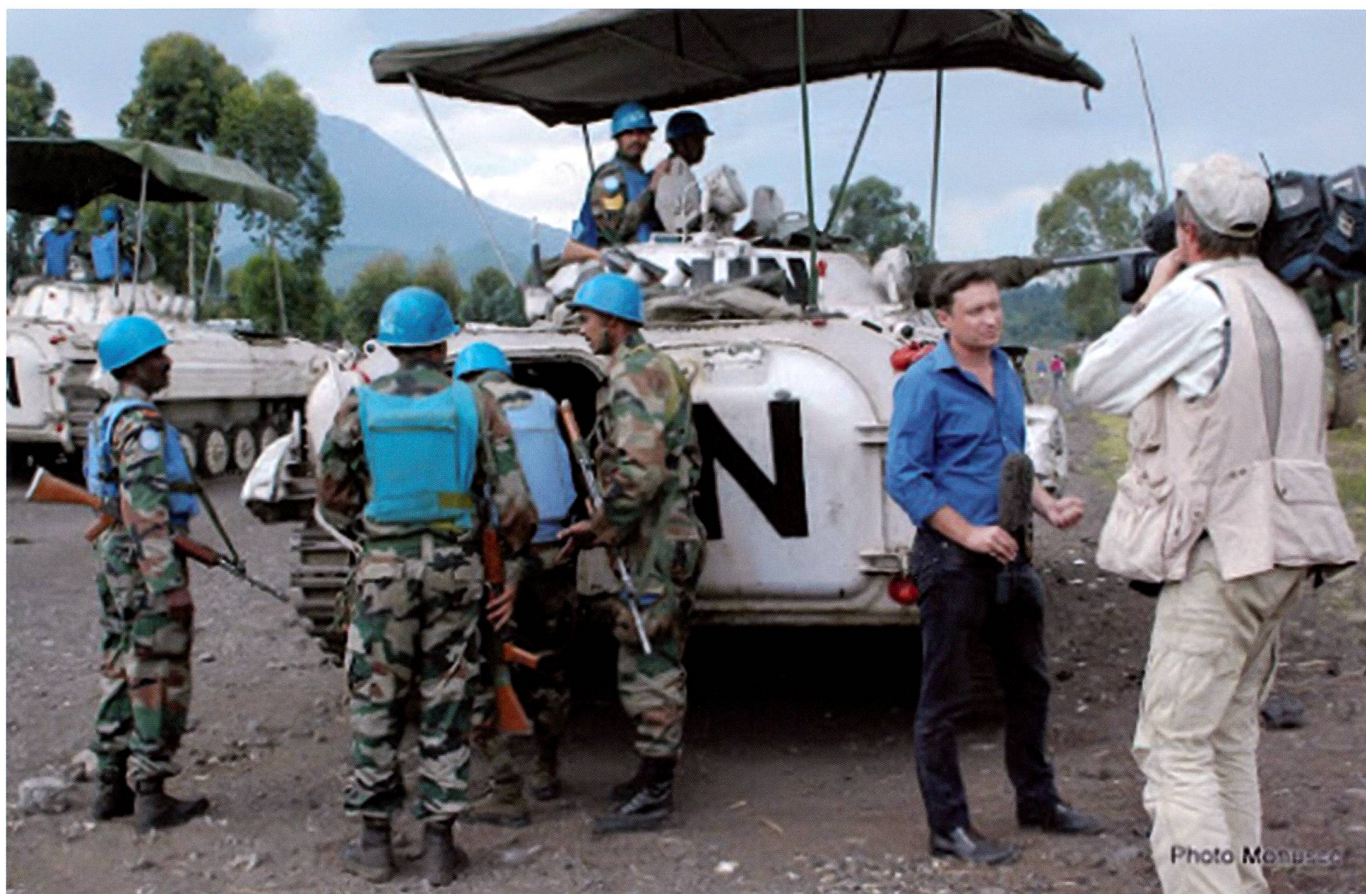
Une équipe de journalistes devant une patrouille de casques bleus. L'Inde a engagé des véhicules de combat d'infanterie (VCI) BMP-2 en RDC au sein de la MONUSCO.

Un an plus tard, en 2013, l'ONU a lancé des véhicules aériens sans pilote dans sa mission en RDC (MONUSCO) et le système a contribué à localiser les camps rebelles, à identifier les mines illégales, à déterminer la présence d'armes, à offrir une connaissance de la situation en temps réel et à sauver plusieurs civils lors d'une noyade dans le lac Kivu en 2014.