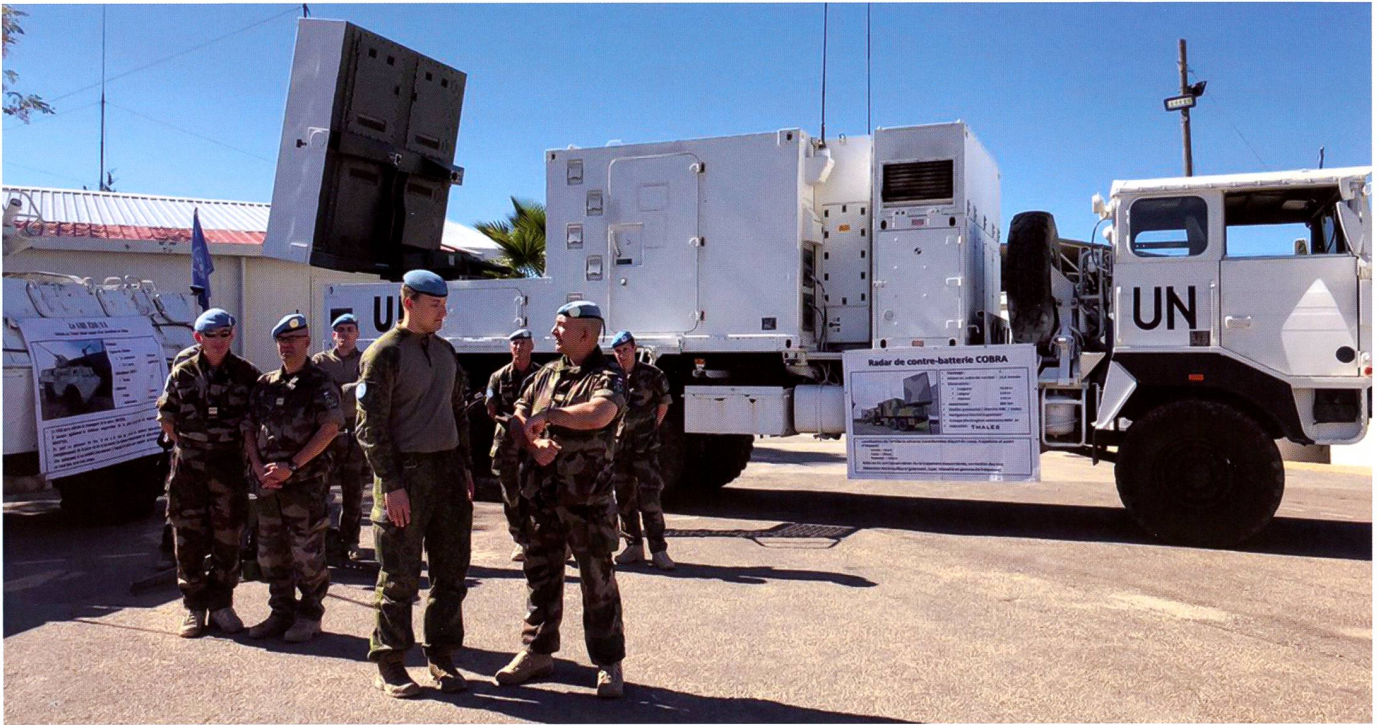
Casques bleus français devant un radar d'artillerie COBRA. Le système a été développé par Thales et est en service en France, en Allemagne ainsi qu'au Royaume-Uni.

formes d'équipements de vision nocturne, on trouve « des casques (lunettes), des lunettes monoculaires, des jumelles ou des viseurs d'armes - généralement des systèmes d'intensification d'image avec une certaine capacité proche infrarouge » ainsi que des systèmes d'imagerie thermique. 17