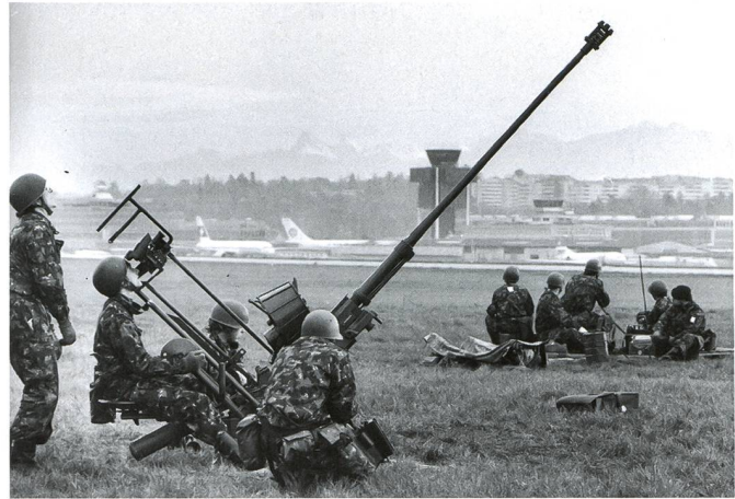
Mise en batterie d'une unité de feu 20 mm (can DCA L 54) sur l'aéroport international de Genève-Cointrin.

Les trois systèmes de défense aérienne actuels – Stinger , Skyguard/35mm et Rapier – sont maintenant âgés et devront être remplacés à partir de 2022. Les canons de 35mm et les Skyguard ont récemment été modernisés pour leur permettre de rester efficaces jusqu'en 2025-2030, alors que la mise hors service du Rapier est demandée par le Conseil fédéral avec le message aux chambres fédérales 2020. Ils représentent les moyens de la défense aérienne de l'espace aérien inférieur (en dessous de 3'000m sol) et ne sont efficaces que contre des appareils volant à basse ou à très basse altitude. Leur portée est limitée à moins de 10 km. La composante sol-air (allemand : BOUDLUV) du programme Air 2030 doit permettre de remplacer partiellement ces systèmes et de réintroduire des missiles de défense sol-air à longue portée.