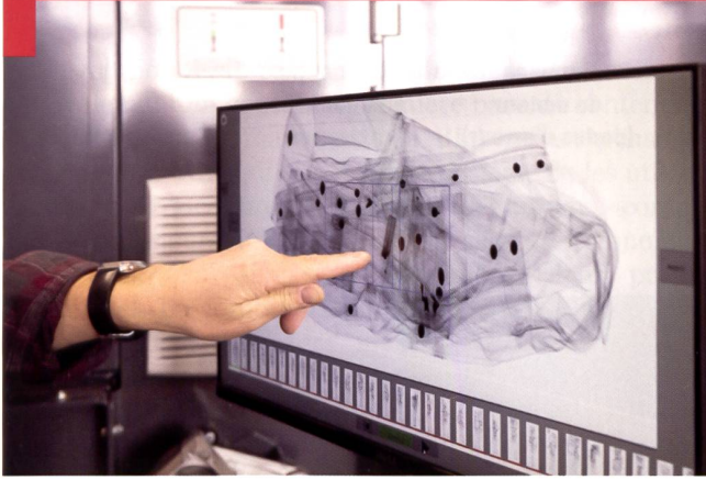
Le scanner textile de la station de lavage de Sursee peut étendre en permanence son répertoire pour détecter d'autres objets étrangers.