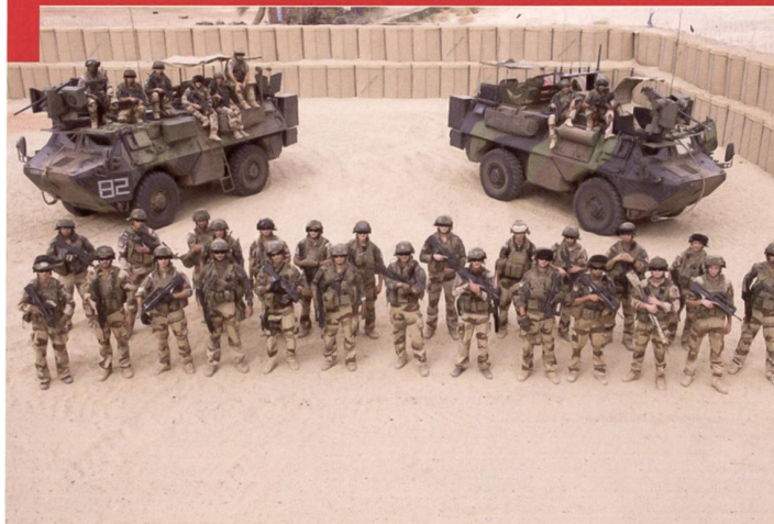
Une section pose devant ses deux véhicules de l'avant blindés (VAB).