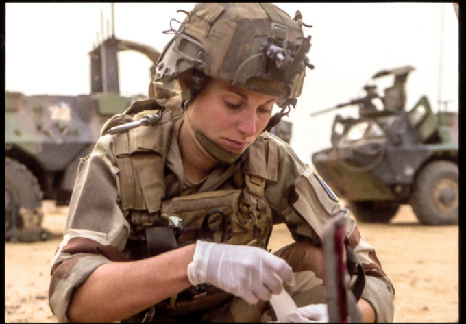
Préparations et déplacement en convois. La photo du bas montre une halte de marche assurée par des véhicules blindés de combat d'infanterie (VBCI).