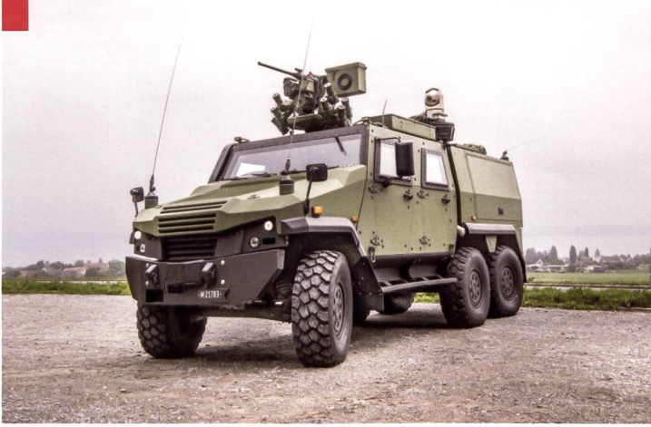
Le Eagle de 5 e génération 6x6 n'est pas un engin de combat, mais il permet d'emporter le groupe d'explorateurs ainsi que son matériel et ses armes, pour lui permettre d'être autonome durant une semaine au moins selon le principe de la « mule ».