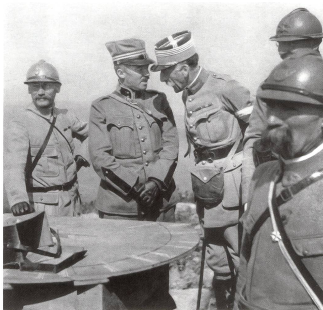
Le lieutenant-colonel EMG Henri Guisan en mission auprès de l'Armée française.