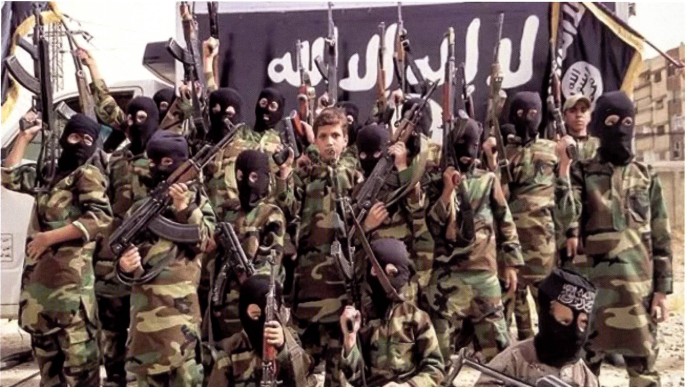
Photo de propagande d'une milice al-Shahab. Ces organisations se disent liées à la mouvance de l'Etat islamique.

deux. Pourtant, le produit national brut par habitant est le plus faible du continent africain, où 50 % de la population vit en dessous du seuil de pauvreté (1,9 US$ – 1,7 € par jour). Après l'attaque de Palma et sa libération quelques jours après par les forces armées mozambicaines, Total a pourtant décidé de fermer son site et de rapatrier tous ses employés vers Mayotte et Maputo. Nul étonnement, dès lors, que le président de la République, Emmanuel Macron, ait à travers un récent tweet rappelé à la suite d'une précédente attaque que « le terrorisme islamiste est une menace internationale, qui appelle une réponse internationale ». L'Union africaine a appelé, quant à elle, à « une action régionale et internationale urgente ».