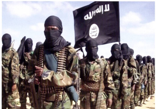
Ci-dessus : Militants islamistes et rebelles.

Ci-dessous : Des unités de l'armée mozambicaine sont employées à des tâches de stabilisation, dans une région riche en hydrocarbures. A proximité du Cabo Delgado, les côtes sont riches en gaz naturel, qui est capté par des plateformes off-shore.