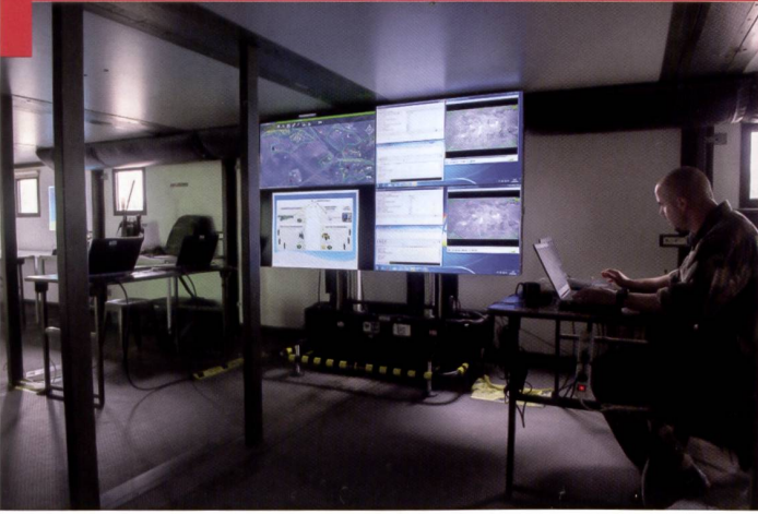
Présentation consolidée de la situation par un officier de renseignement de l'armée de Terre française.