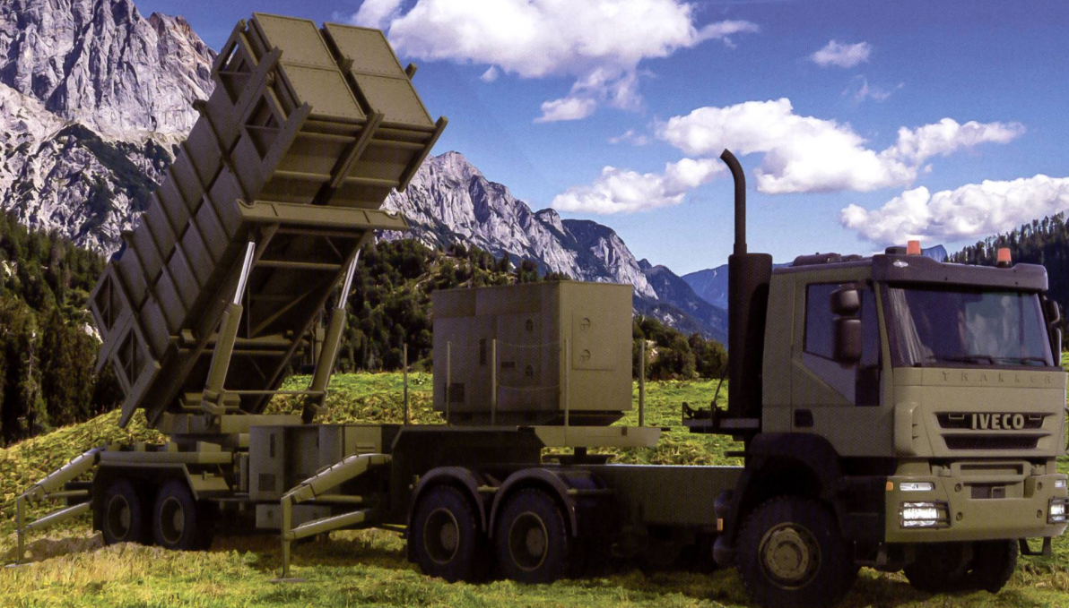
Image: Poste de commande Patriot Suisse

Une vision partagée. Une mission commune. Un partenariat idéal offrant une solution éprouvée pour aider la Suisse dans la défense de sa souveraineté, et renforcer son industrie. Avec le système Patriot, ® la Suisse rejoindra sept nations européennes bénéficiant des avantages d'une défense aérienne moderne et performante.