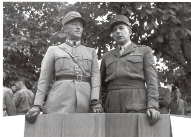
Lors de la campagne d'Alsace, De Lattre rencontre le général Guisan à la frontière suisse. Il remet d'ailleurs à cette occasion plusieurs épaves d'engins blindés qui font désormais partie de la collection du musée de Thoune.