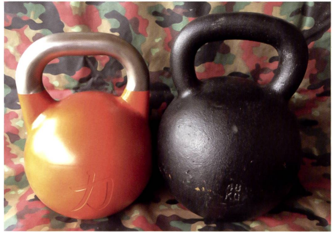
Kettlebell de marquage et Kettlebell ex expl (KB ex expl 48).