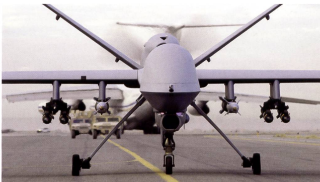
Le drone MALE Rapier .