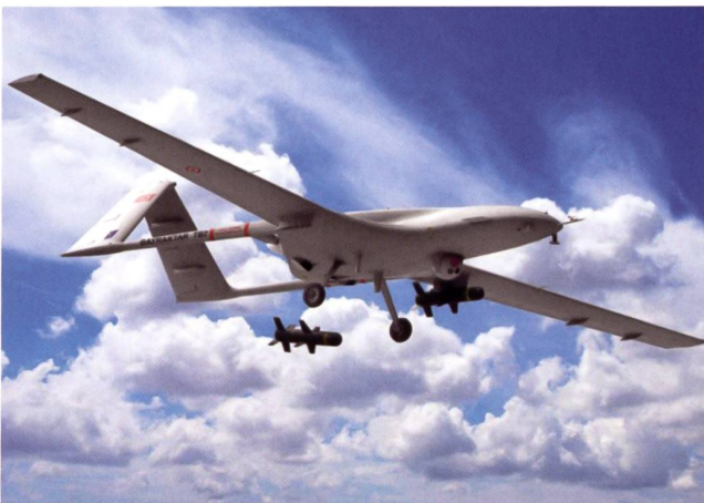
Le drone turc Bayraktar .