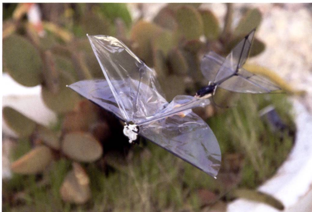
Un micro-drone Papillon-Libellule , totalement silencieux.

L'essaim s'avère très difficile à neutraliser ou à détruire, car il peut subir le feu ennemi, essuyer des pertes et rester opérationnel, alors que l'on aurait de grandes chances de détruire des drones engagés isolément et, surtout, de mettre fin à leur opération. L'adversaire se trouve dans l'obligation de consacrer des moyens importants à la lutte « Anti-essaims ». Le coût d'un essaim de micro-drones non réutilisables, y compris celui des études et des mises au point, n'a rien de comparable avec le programme américain d'avions de combat interarmées F-35 (1'500 millions de dollars US), le prix unitaire d'un tel appareil (80 millions), celui d'un missile naval, air-sol et antinavire (1 million). Tout cet arsenal est infiniment plus cher qu'un essaim de Coyotes à 5000-7000 dollars l'unité!