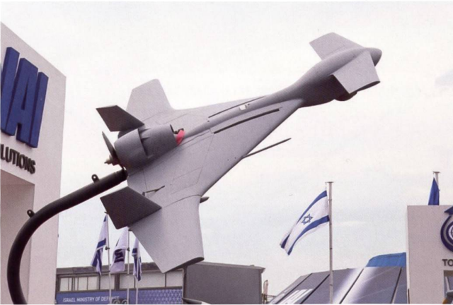
Le drone israélien Harop .