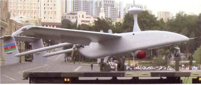
Le drone israélien Aerostar .