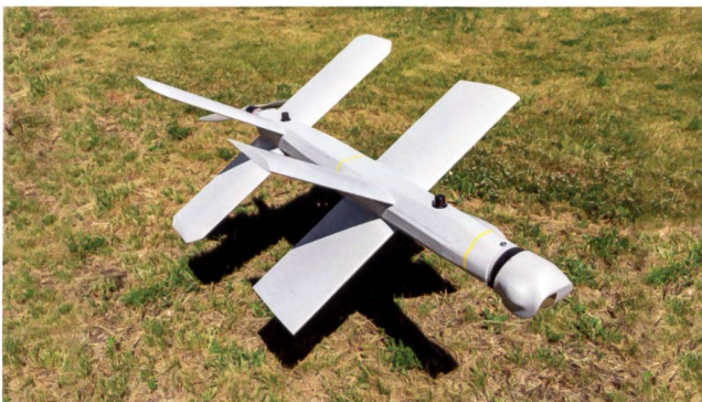
Le drone-kamikaze de Kalachnikov.