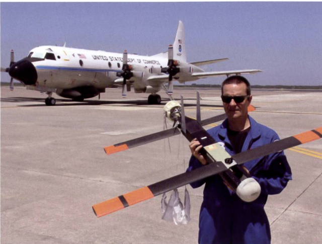
Le micro-drone Coyote .

Lors de cet essai, la Navy parvient à lancer 30 drones en 40 secondes, à les regrouper rapidement en essaim, à les faire évoluer en formation de façon autonome pour mener à bien la mission. Comme ces drones ne disposent que de