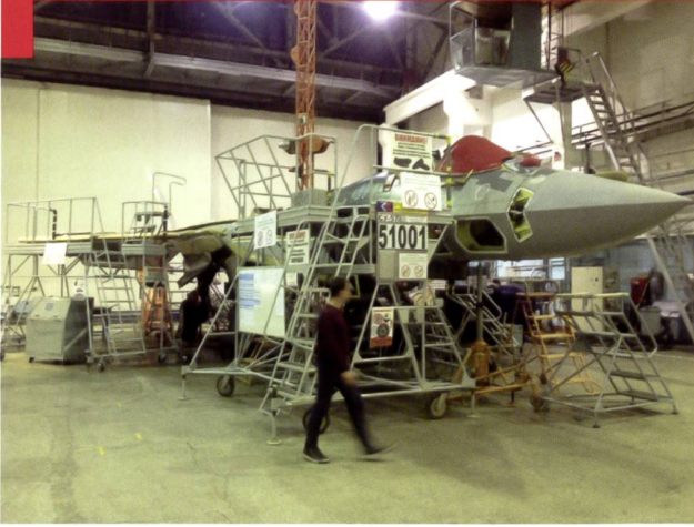
Le premier Sukhoi 57 de série, issu du Projet PAK FA ou T-50 a été remis aux Forces aériennes russes en décembre 2020.