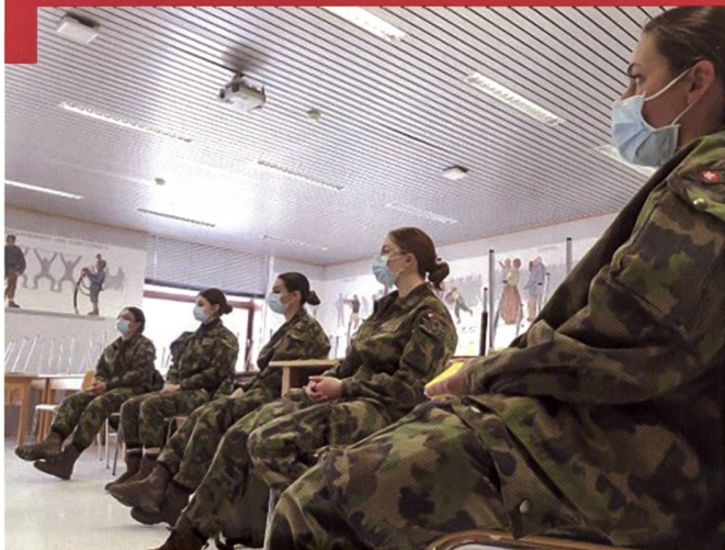
Les participantes au workshop ont pu découvrir une visualisation de leur carrière militaire d'un seul tenant.