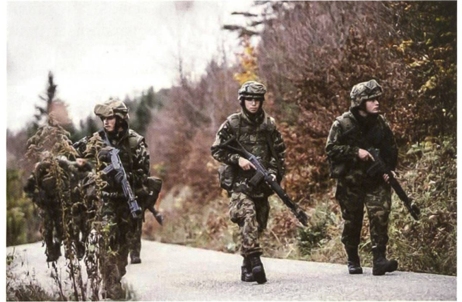
Quatre illustrations de l'école d'officiers d'infanterie, printemps 2019.