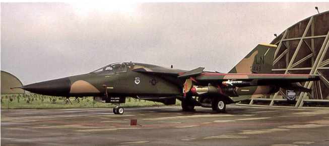
Le F-111F modernisé est en mesure d'emporter et de guider des armes grâce à une nacelle ventrale, escamotable. Cet appareil du 493 TFS porte deux bombes GBU-15 de 1'000 kg et des missiles air-air AIM-9 d'autoprotection.