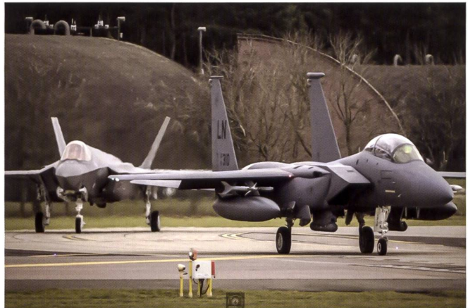
La relève est assurée : un F-35A du 495 FS suit son prédécesseur, un F-15E du 494 FS.

D'autres améliorations ont été prévues et développées – notamment un nouveau système de guerre électronique et de contre-mesures d'autoprotection baptisé EPAWSS ainsi que de nombreuses options tirées de l'ambitieux programme Silent Eagle , destinées à réduire la signature radar très importante du F-15. Certaines mises à jour permettent l'emport d'armements supplémentaires – portant à 16 le nombre de missiles air-air pouvant être emportés pour la mission de supériorité aérienne. Il est également prévu que les pylônes soient adaptés pour permettre l'emport d'un engin de 3 tonnes – un missile hypersonique, par exemple. Les options retenues prennent la désignation de « EX ».