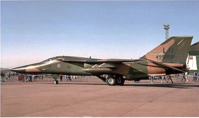
Ce F-111E (ici aux couleurs du 495 TFS) dans sa version de base, a été conçu comme bombardier tactique conventionnel.