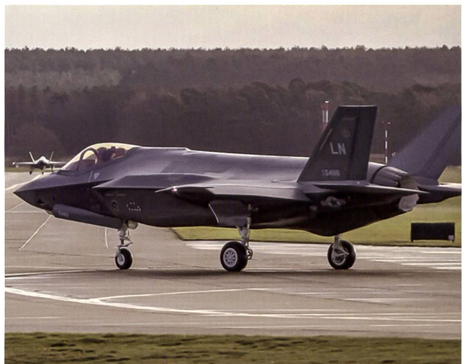
Arrivée de deux F-35A du 495 FS sur leur nouvelle base d'attache.

Un F-35A de la même escadre au roulage. Le déploiement de ces appareils renseignera sur les conditions d'utilisation et de maintenance du JSF dans des conditions météorologiques souvent difficiles.