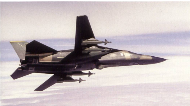
Un F-111F du 493 TFS a sorti sa nacelle de visée et de guidage ventrale Pave Tack et emporte quatre bombes à guidage laser GBU-10 Paveway II de 1'000 kg.

Préparatifs pour l'envol des F-111F partis bombardier la Libye le 14.04.1986. L'appareil emporte quatre bombes GBU-10.