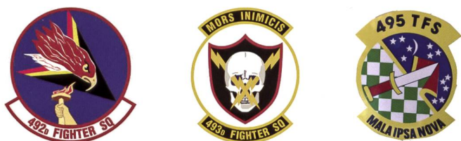
Insignes des trois escadrilles de la 48 e escadre.

La décision du Général de Gaulle de ne plus accepter l'entreposage d'armes atomiques sur le sol français, en 1959, a pour conséquence le redéploiement de nombreuses unités de l'USAF. Le 15 janvier 1960, tous les chasseurs-bombardiers F-100 Super Sabre du 48 th Fighter Wing quittent Chaumont-Semoutiers et prennent leurs quartiers le même jour à Lakenheath. L'escadre se compose alors de trois escadrilles : les 492 nd , 493 rd et 494 th Tactical Fighter Squadrons. Conformément à la pratique de l'époque, les appareils portent encore des marquages « haute visibilité » et des codes permettant d'identifier les unités : bleu pour la première (LR), jaune pour la seconde (LS) et rouge (LT) pour la troisième.