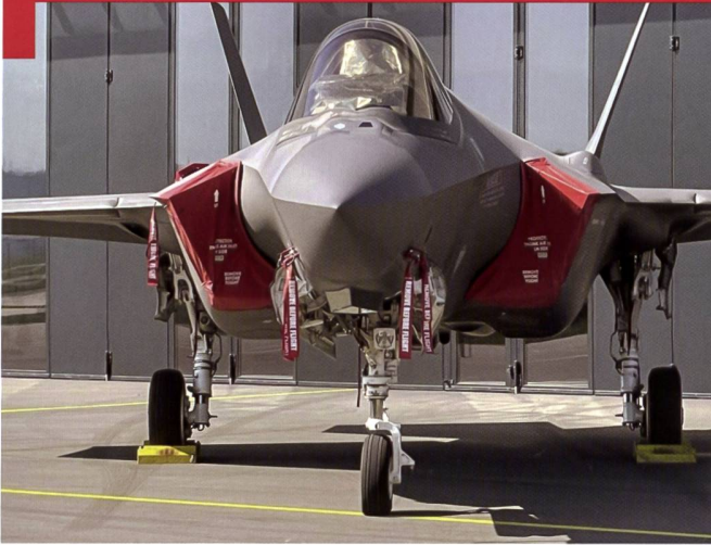
Toutes les photos de cet article : Présentation du F-35A en Suisse.