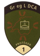
Une unité de feu Stinger sur une place de travail technique dans le Bas-Valais.