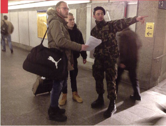
Gare de Thoun : Orientation des nouvelles recrues, qui se rendent à pied ou en bus au « polygone » pour le début de leur école de recrues.